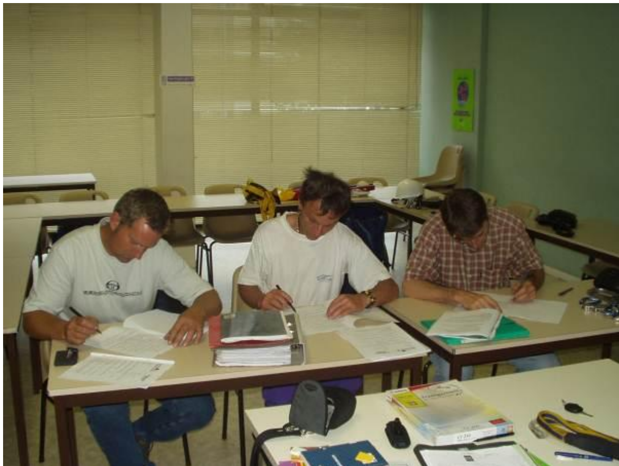
Lors du test théorique final